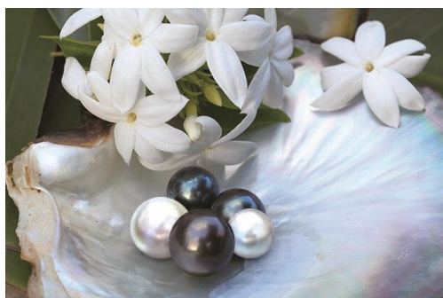
白蝶真珠・黒蝶真珠

真珠は肌になじみやすい美容成分として知られており、古くはクレオパトラや楊貴妃も美容のために飲んでいたと言われています。厳選した2種の真珠から得た成分 ※2 配合で、年齢悩みにアプローチ。見た目も美しい美容液で、肌の基盤 ※6 を整えて、すこやかな艶肌へ。