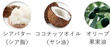
シアバター (シア脂) ココナッツオイル (ヤシ油) オリーブ 果実油