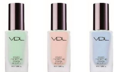
01 ミント 02 ローズ 03 ペールブルー